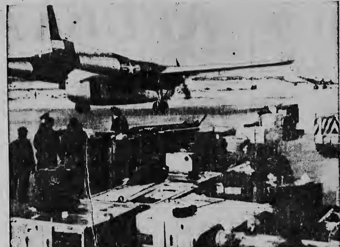
Van de grote Amerikaanse luchtbasis op Okinawa uit worden goederen naar Formosa vervoerd. Op dat eiland is momenteel de 18e Fighter-Bomber Wing van de vijfde luchtmacht gestationneerd.